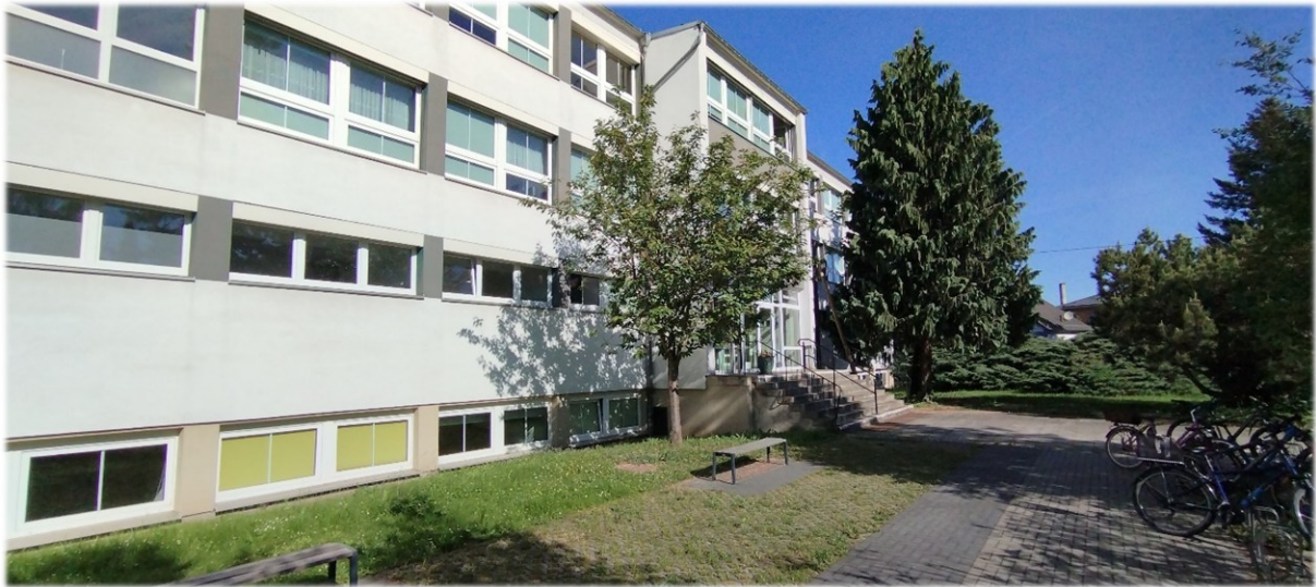
Schulgebäude – Außenansicht