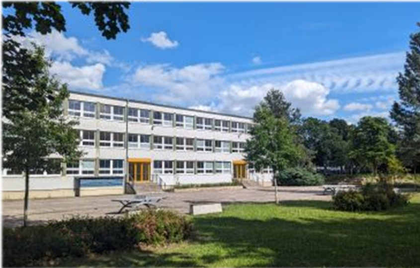
Unser Schulgebäude – Hofansicht

Unsere große Sporthalle und das weitläufige Außengelände bieten viele Möglichkeiten für den Unterrichts- und Freizeitsport.